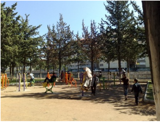
trim-attributen in park

Ik hoor van mij familie dat het in Nederland erg naar weer is. Erg koud en nat. Ik geniet nog even van het weer hier. 30 graden en een lichte bries. We wonen wat dat betreft toch echt in een verkeerd land.