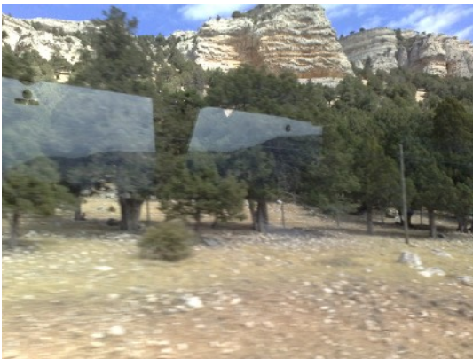
rotsen en woestijnen

We gaan op weg naar Mut. Op advies van Herman Post nemen we de bus. We lopen de stad uit naar de Otagar. Onderweg in de hoofdstraat 8 apothekers op een afstand van 100 meter!