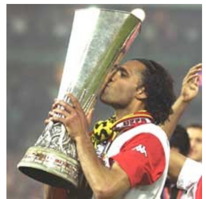
Pierre van Hooijdonk

's Middags maken we een wandeling naar Gedik. Een plaatsje 7,5 kilometer van Mut. Op de terugweg politiecontrole. Eén baas, een chauffeur en twee jonge jongens met geweren in de aanslag. Pierre van Hooijdonk, een voetballer bij Galatasaray, is erg bekend hier en dus ook bij de politie. Niks aan de hand.