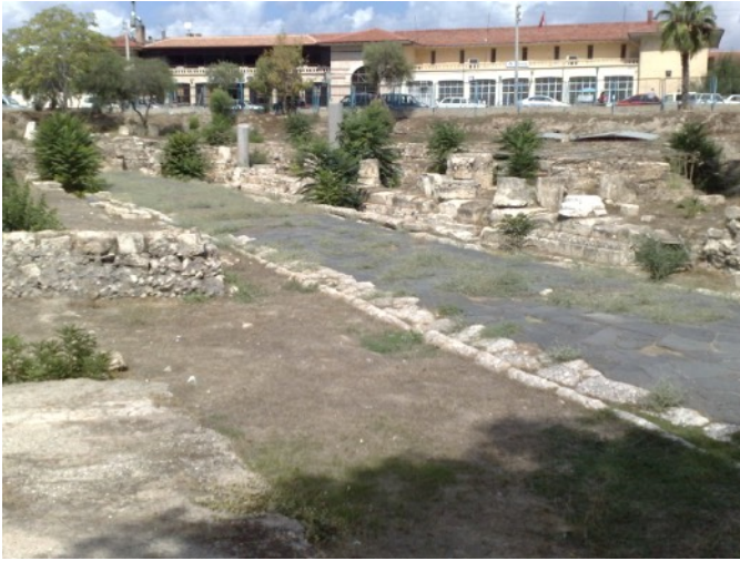
Tarsus: oude romeinse weg

We zien veel manke, kreupele, scheefgegroeide mensen. Al dan niet met krukken. Naar onze begrippen zijn deze mensen medisch niet goed behandeld.