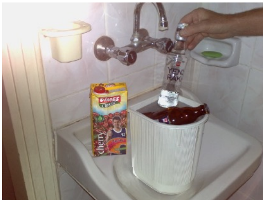
Kareman: onze koeling

Vandaag met de bus van Cumra naar Karaman. Er wonen 200.000 mensen in deze stad. We verblijven in het centrum in een hotel. We verkennen de tocht voor morgen richting Derekoy.