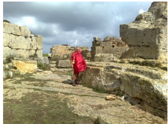
St. Simeon Stilitisklooster

Toen ik vanmorgen vertrok was het erg stil in de stad. Er waren geen mensen en de winkels waren dicht. Het was Suikerfeest. Het einde van de Ramadan. 's Middags trof ik honderden mensen aan in het prachtige park.