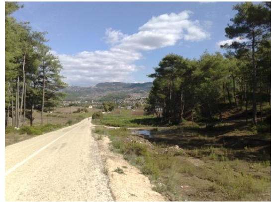
zicht op Yayladagi vanaf de grens

De weg van Antakya naar Yayladagi is lang [ongeveer 60 km.] en eentonig. Op veel plaatsen uitgehouwen uit de rotsen. Verder is het heuvelachtig met onvruchtbare grond. Er liggen geen plaatsjes op de route. Deze liggen [ver] van de hoofdweg af. Niet erg aantrekkelijk om deze weg te voet af te leggen.