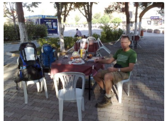
Kareman: ontbijt in het park

Gisterenavond het raam opengezet. Veel muggen binnen. Er was geen hor maar het was stikkend heet.