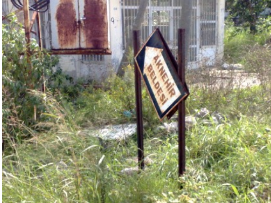
Aknehir Beldesi. start route

De afgelopen dagen heb ik begrepen hoe het zit. Er komt zoveel hemelwater omlaag en er zal nog erg veel komen zodat alles wat rivier heet erg hard nodig zal zijn.