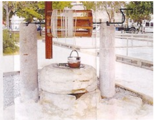
St. Paulus Kerk en bron