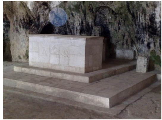
Antakya: altaar in kerk Petrus

In de Handelingen van de Apostelen (hoofdstuk 11, 26) staat: "Hier in Antiochië werden de volgelingen voor het eerst christenen genoemd. In dit gebied, in deze kerk (ruimte) hebben Petrus en Paulus (van Sarrus) elkaar gesproken". Het