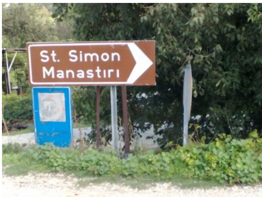
die kant op

Na Simeon is het een versterkt monniken klooster geweest. Thans is het een ruïne. De monniken sliepen in de rotsen uitgehouden cellen. Stilitis betekent zuil.