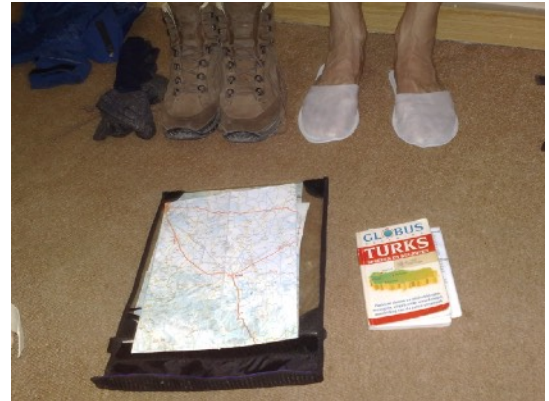
in hotel: schoenen uit, sloffen aan

Tijdens mijn gehele wandeling door Turkije heb ik steeds gezocht naar de Turken die in Nederland wonen en werken. Nou heb ik ze gevonden. Ze komen uit Karaman. Ik heb er vele gesproken. In juli en augustus is het hier toptijd.