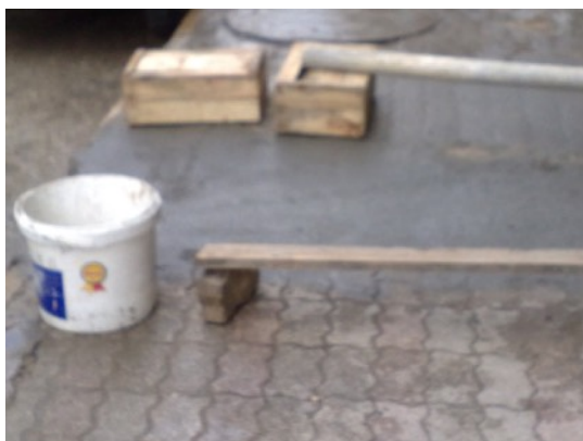
iedereen verzorgt zijn eigen stoep

Ik maak een wandeling om Antakya heen. Langs de rotsen en door de sloppenwijken. Wat een arrenmoede. Slechte wegbedekkingen of helmaal niet. Verkeerslichten zijn er nauwelijks en het stromende water uit de rotsen maakt alles tot een modderpoel. Antakya telt 200.000 inwoners. Het merendeel in de sloppenwijken.