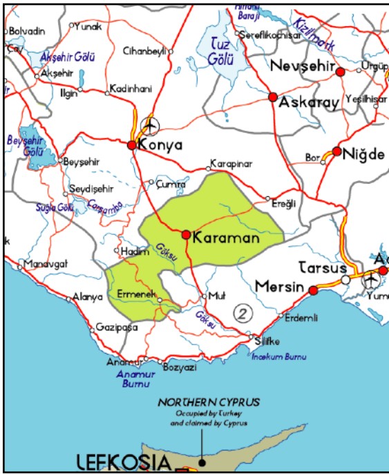
Karaman en omgeving

De hele nacht zo'n beetje bezig geweest om verkoeling te zoeken en de muggen te pletten. Vandaag hebben we een goed hotel gevonden. Met hor maar geen airco.