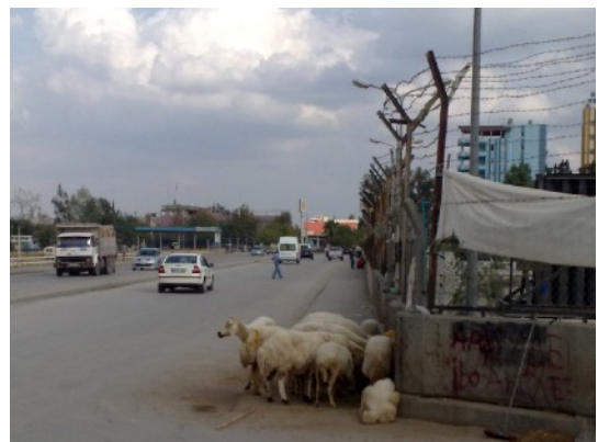
nog meer schapen

Een klein radar bootje haalt het wier, de algen op.