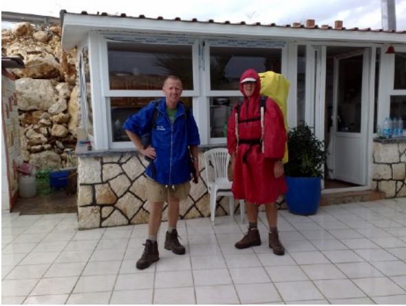
De eerste regen