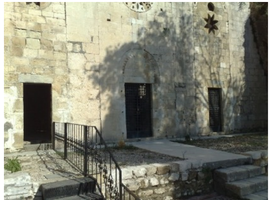
de drie ingangen