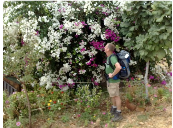
Bij ons is het najaar

Voor mij van belang voor mijn tocht volgend jaar door Syrië.