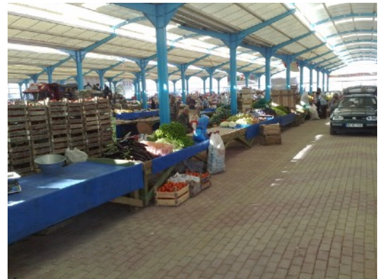
Cumra, in de markthal

We komen in contact met een turk die 8 jaar in Amsterdam heeft gewerkt. Kleermaker was en dat is hij nu nog steeds. Heeft een leuk winkeltje hier in Cumra. Een maatkostuum kost hier 160,-- In Amsterdam op het Rokin 500 tot 600,-- zegt ie.