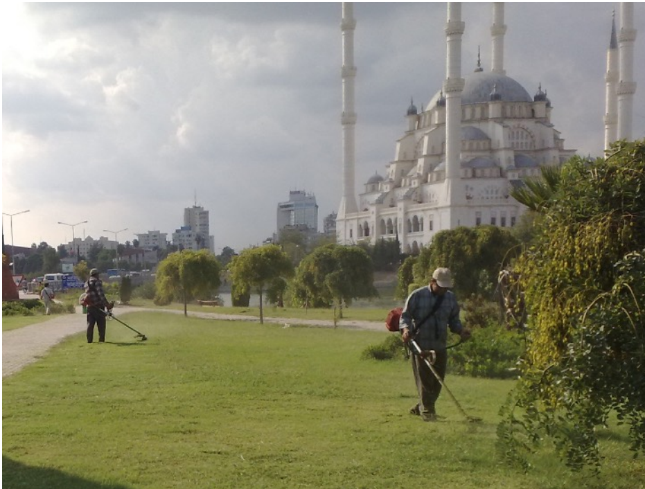
Adana: prachtige parken