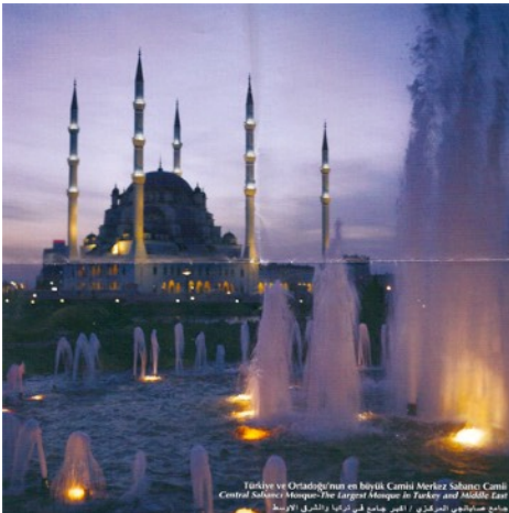
Central Sabanci Moskee