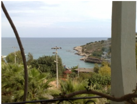
Vanuit hotel in Narlikuya

Met de bus naar Silifke. Bijna de gehele route langs de rivier de Göksu gereden. Nu een heel klein rustig riviertje. Maar 's winters aanzwellend tot een wilde onstuimige rivier die tussen de rotsen door naar zee loopt. Het water komt van het Taurusgebergte.