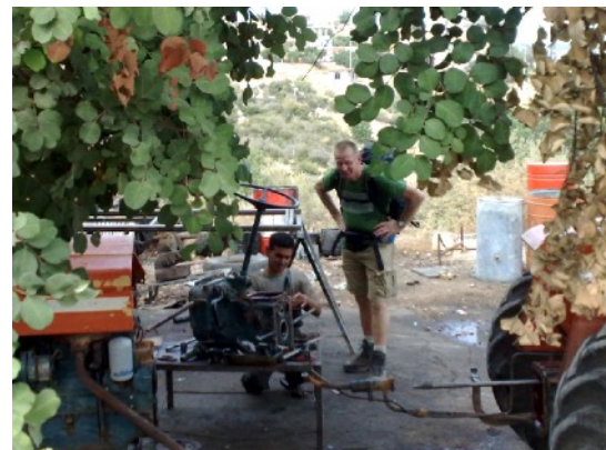
Tractor: geheel uit elkaar

Het water was afgezet. het was een simpel hotelletje van 35 liras (ongeveer € 22,-), maar erg simpel. Op de vloer aangestroken metselspecie. Niet echt gezellig. Goed geslapen!