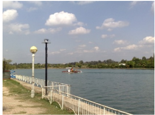
Adana, ophalen wier/algen

Het park dat in het zuiden naast de Seyhan ligt is een oase voor jong en oud. Speeltuinen, vissen, schieten met de roos op het water,