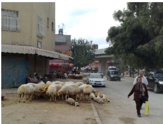
Adana: schapen in het centrum