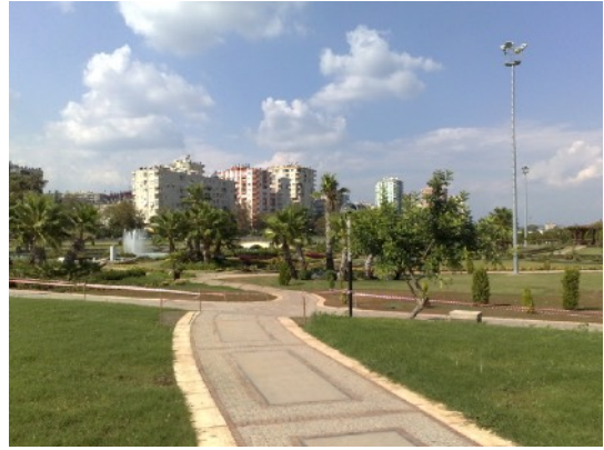
Adana: prachtige parken