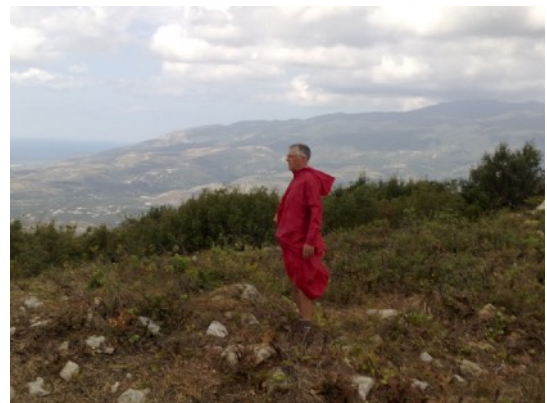
met uitzicht op zee