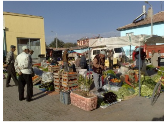
Cumra, vóór de markthal