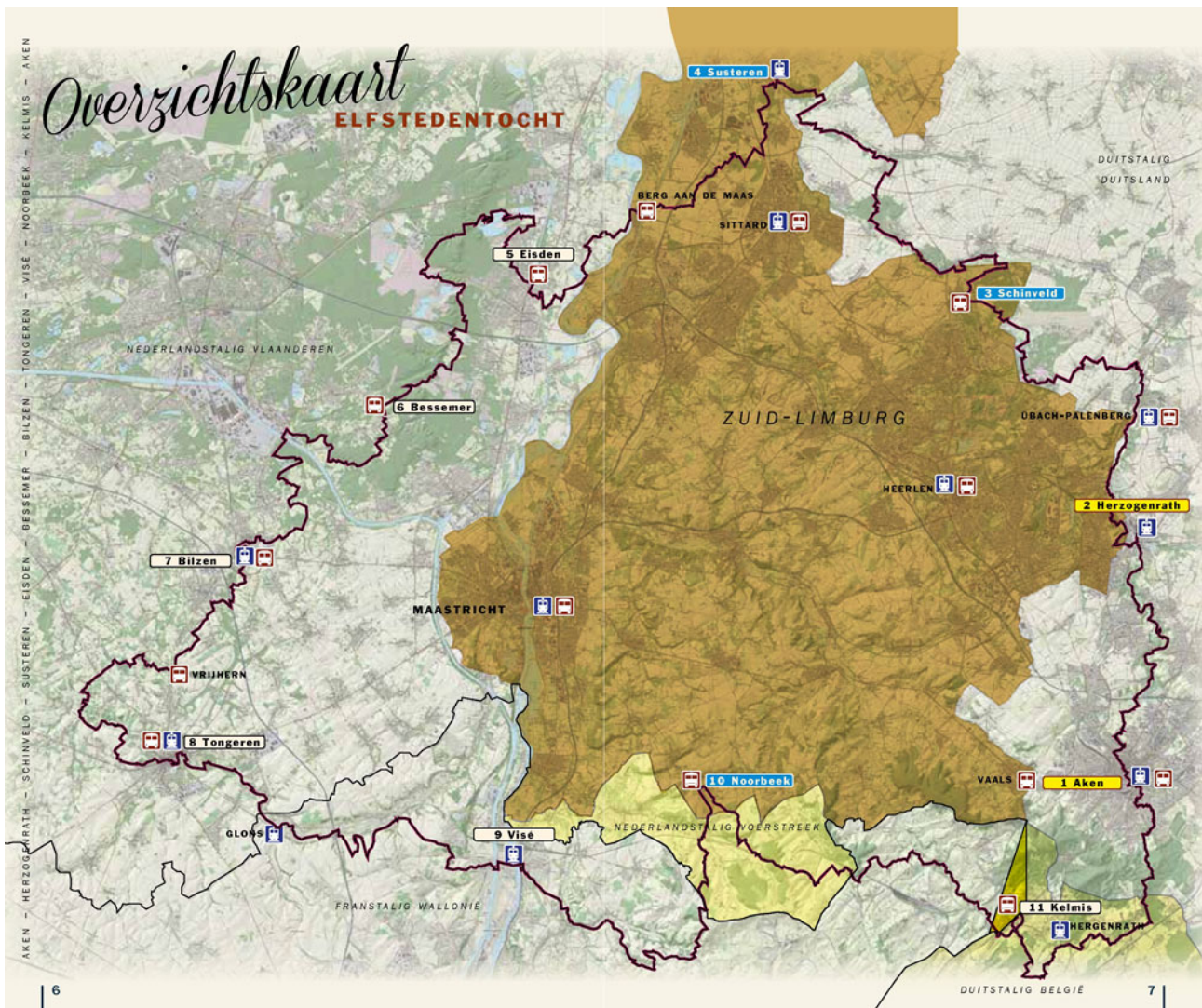
Uit: Wandelgids Een wandeling rondom Zuid-Limburg | Gegarandeerd Onregelmatig door Alex Buis.